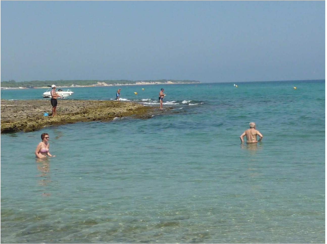
01 settembre 2015 Bagno agli Alimini