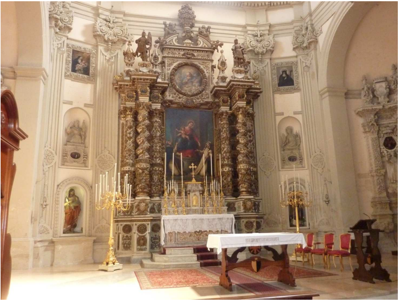
02 settembre 2015 L'altare della cattedrale di Lecce