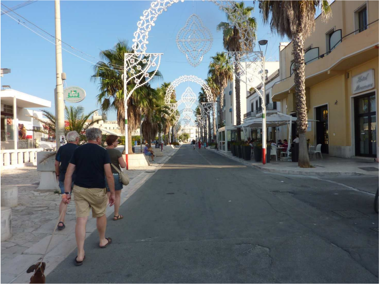
03 settembre 2015 a passeggio sul lungomare di Otranto