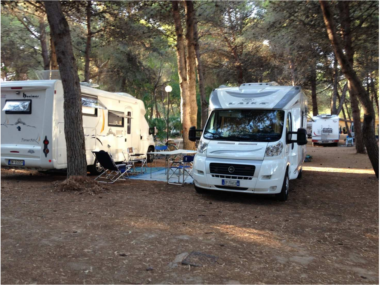
31 agosto 2015 Camping Sentinella a Torre dell'Orso