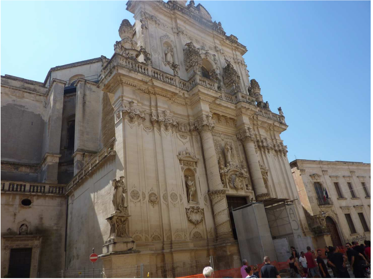
02 settembre 2015 La cattedrale di Lecce