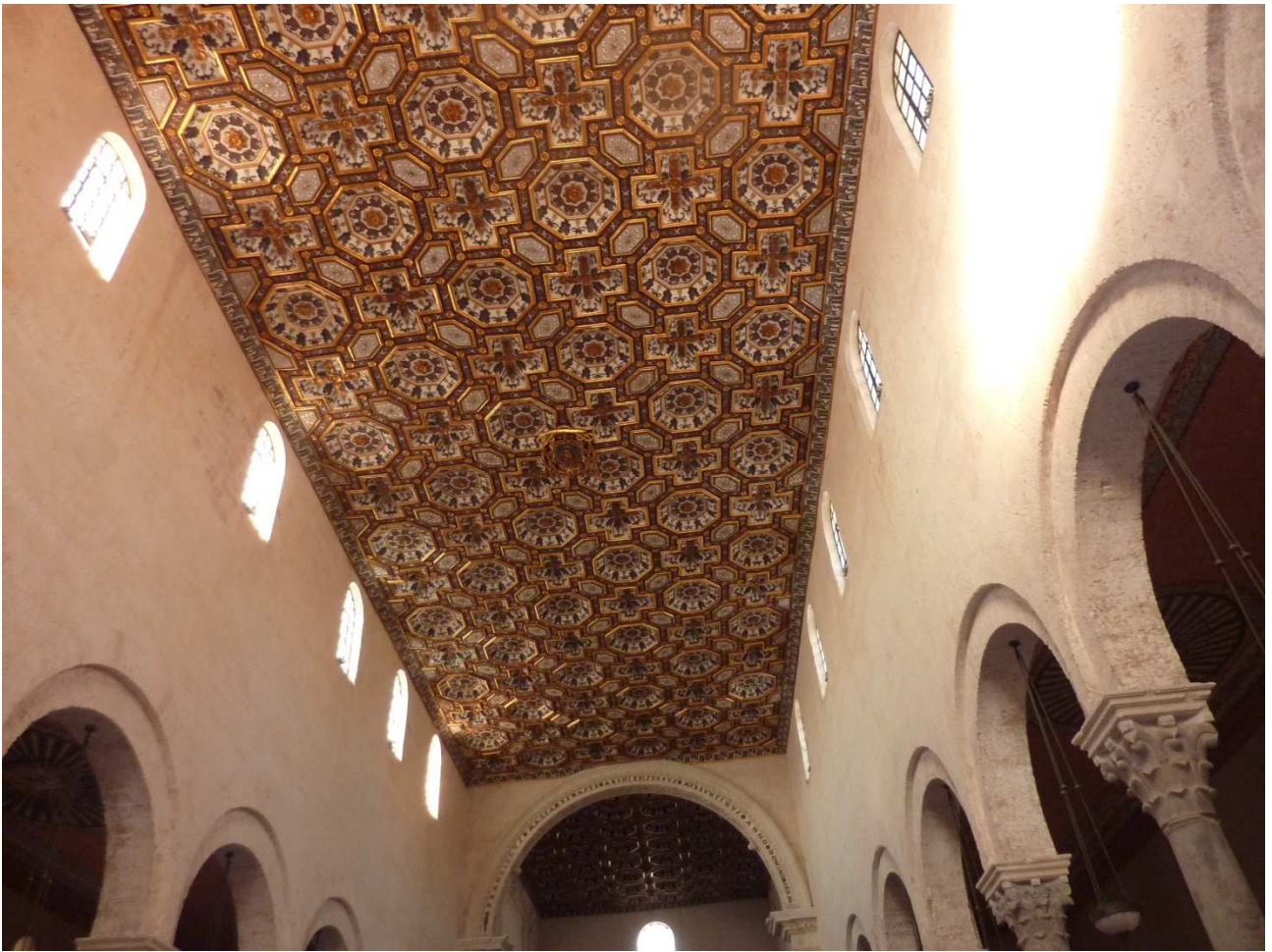
03 settembre 2015 Otranto ..... particolare del soffitto della cattedrale.