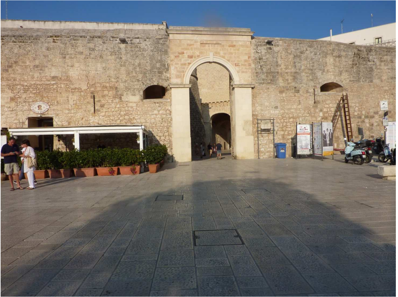
03 settembre 2015 Otranto ..... porta d'ingresso al centro storico