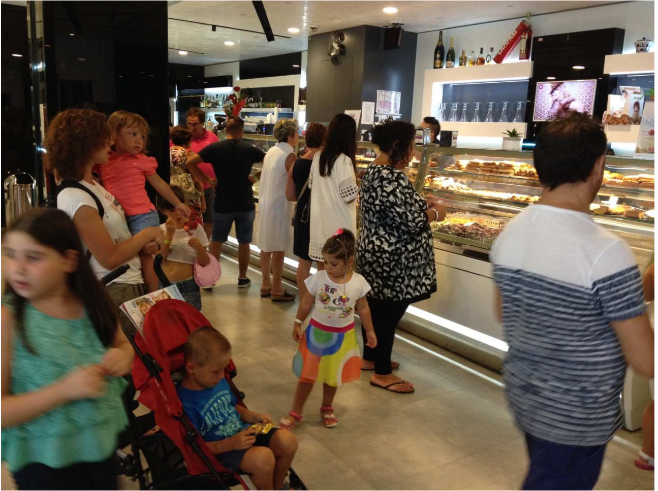
01 settembre 2015 Torre dell'Orso ..... al bancone della pasticceria gelateria Dentoni