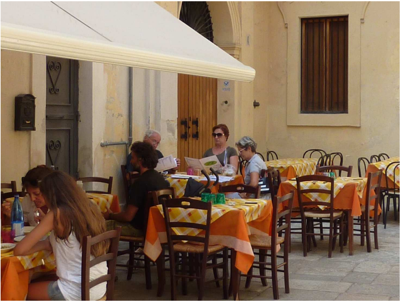
02 settembre 2015 Lecce lettura del menù al ristorante