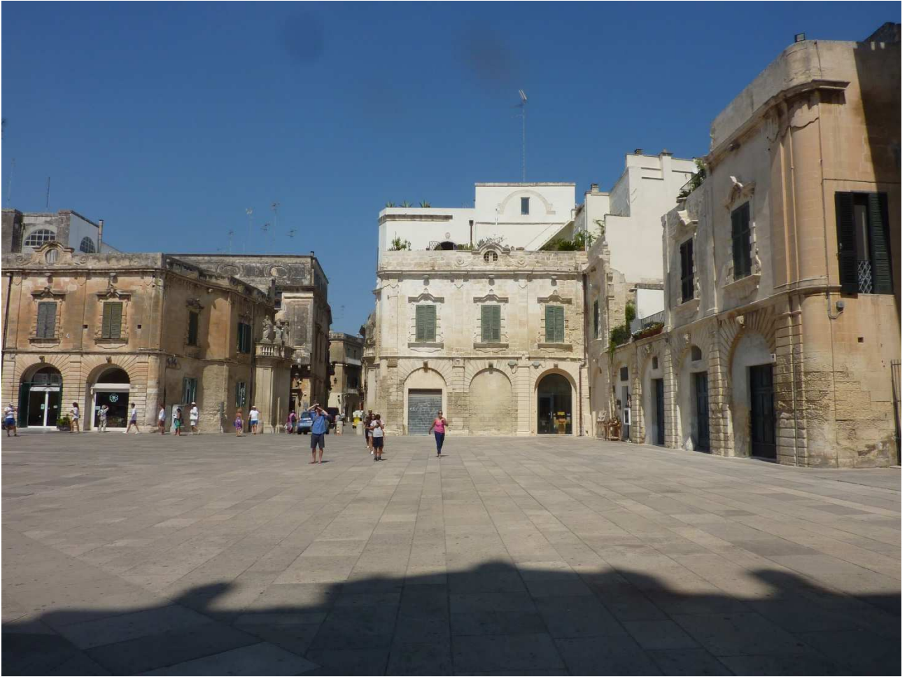
02 settembre 2015 Lecce piazza del Duomo