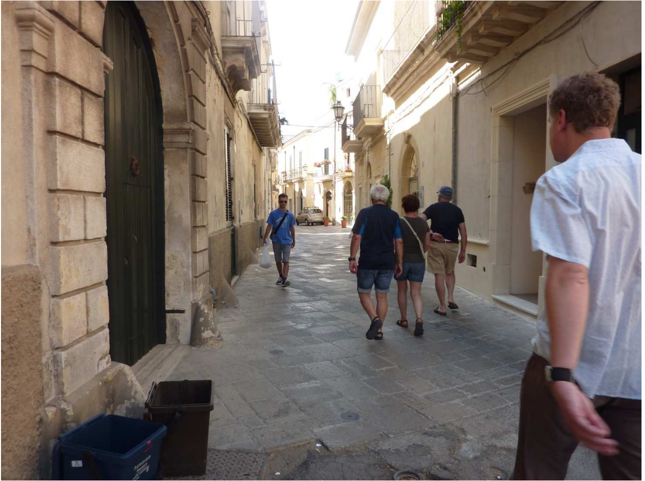
02 settembre 2015 Per le strade di Lecce