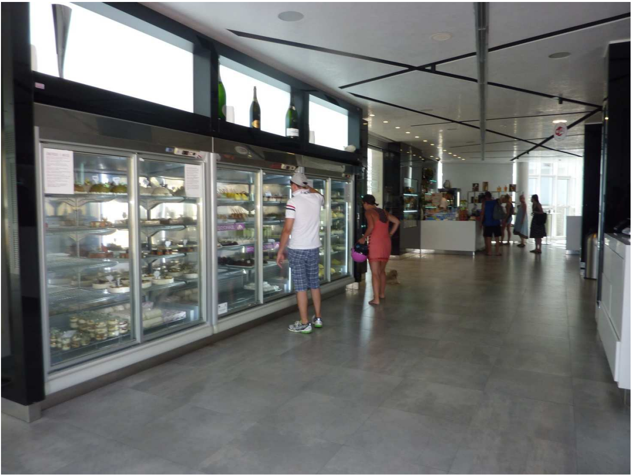
01 settembre 2015 Torre dell'Orso Vetrine della gelateria Dentoni