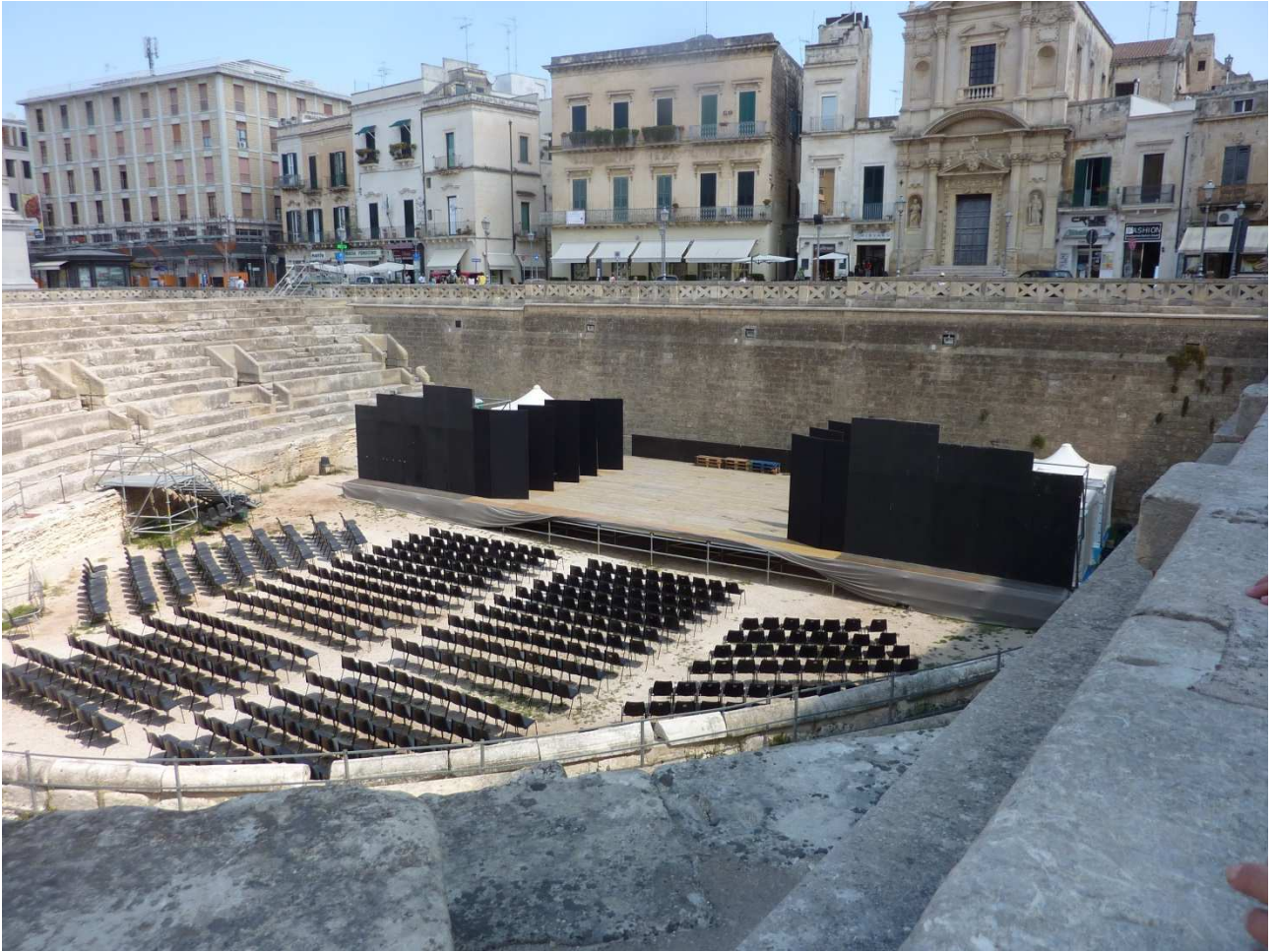
02 settembre 2015 Lecce l'anfiteatro romano