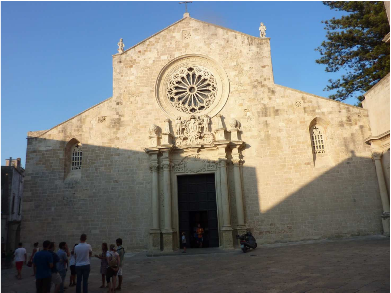
03 settembre 2015 Otranto ..... facciata della cattedrale.