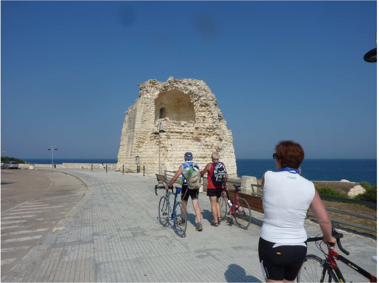
01 settembre 2015 Torre dell'Orso ..... la torre appunto