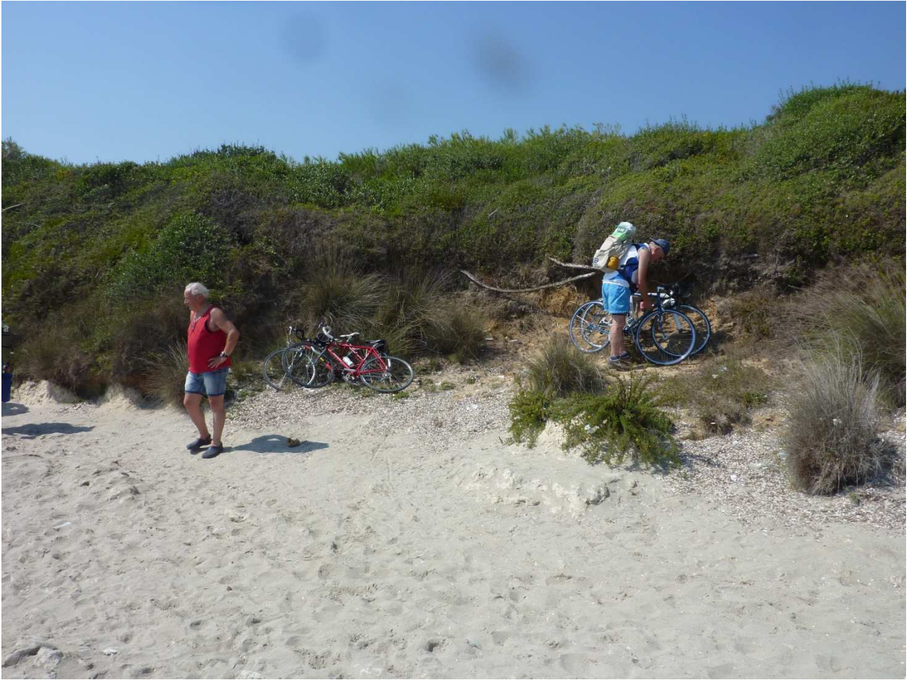
01 settembre 2015 Parcheggio bici agli Alimini