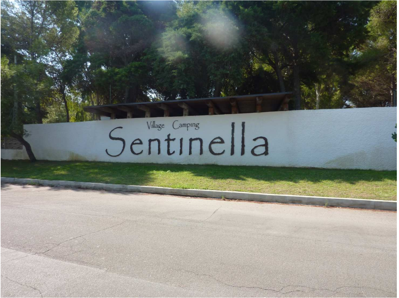
01 settembre 2015 Camping Sentinella a Torre dell'Orso