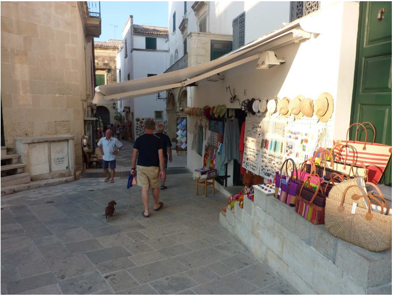
03 settembre 2015 Otranto ..... a spasso per il centro storico