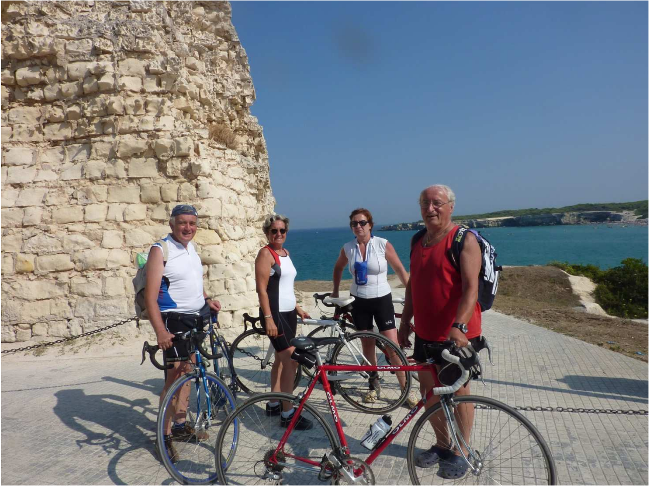
01 settembre 2015 Torre dell'Orso foto ricordo ai piedi della torre