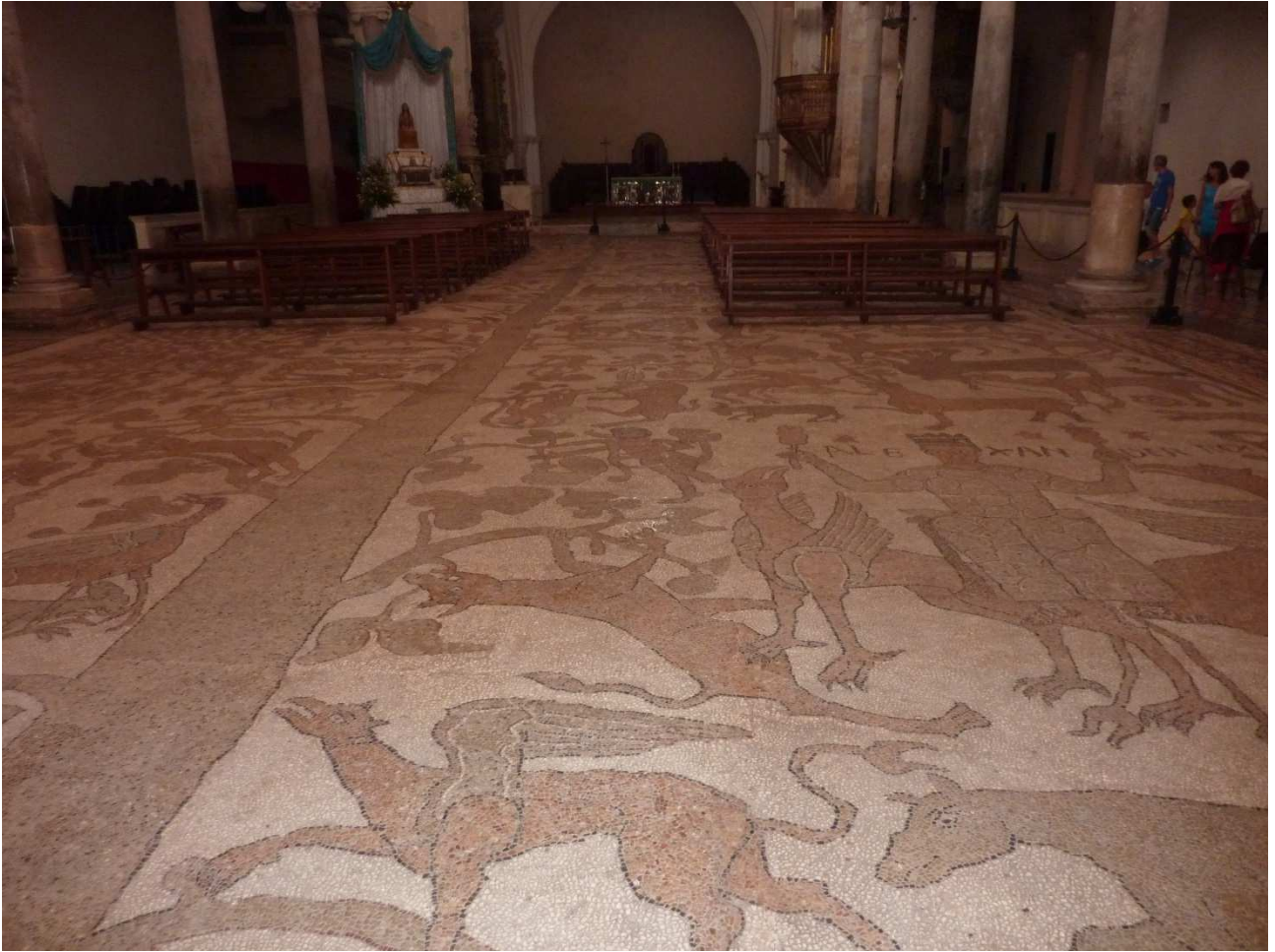
03 settembre 2015 Otranto ..... particolare del pavimento della cattedrale.